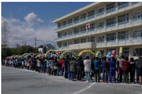
門出を応援するアーチをくぐる卒業生