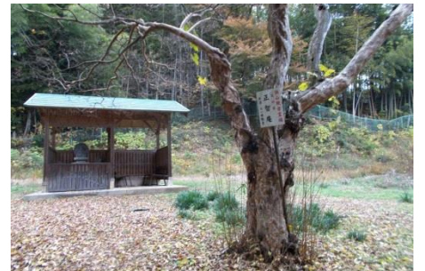
ひっそりとたたずむ正智庵

続いて狭山三十三観音札所四番「正智庵」へ向かいました。椿峰丘陵への狭い参道を上って行くと、今にも朽ち果てそうな百日紅（カハナリ）の大木と小さな庵が目に入ります。庵には石像が三基あり、中央に本尊十一面観音が鎮座しています。ここも川辺地区で「武州入間郡上山口村」と刻まれた石碑があります。敷地奥の崖下に今にも埋もれそうな墓誌と碑があります。苔むして気付きにくく、見落とすところでした。刻まれた文字から読み取れるのは下記です。