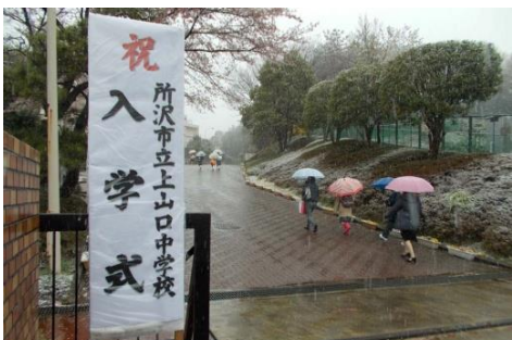
降雪の中での入学式は忘れません