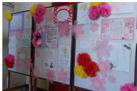
うれしい恩師からの祝電