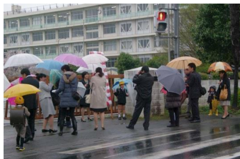
希望の詰まったランドセルで初登校