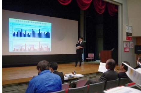
30年間で土砂災害は1.5倍増