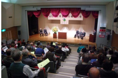
雨天にもかかわらず77名が参加

後半は所沢警察署生活安全課長の「振り込め詐欺防止について」の講演がありました。最近の犯罪傾向、構成等の説明の中で、振り込め詐欺は依然として増加しています。平成 26 年中の所沢市の被害者は 70 歳代が 18 人 (46.1%) と多く、全体では女性が約 80% を占めるということです。「相手からお金の電話は要注意！」怪しい電話を受けたら直ちに警察署に相談して下さい。