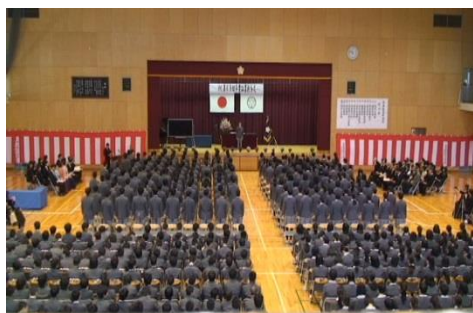
厳粛な空気に包まれた卒業式会場

※参考 山口地区の卒業生：小学校 272 名 中学校 350 名 同新入生：小学校 277 名 中学校 340 名