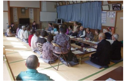
健康の秘訣「笑う門には福来る」

茶話会は、70歳以上の方を対象としています。遠くまで出かけて行かなくてもいいように、年に数回、会場を変えて開催していますので、ぜひ、ご近所といっしょにお近くの会場にお越し下さい。