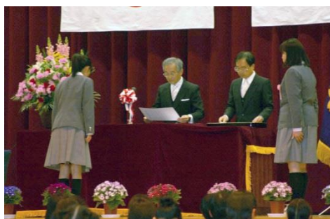
15歳の旅立ちに大きな拍手を