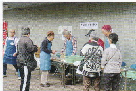
お父さんたちも張り切って料理の腕を披露しました。