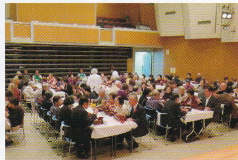
なごやかな食事会です。