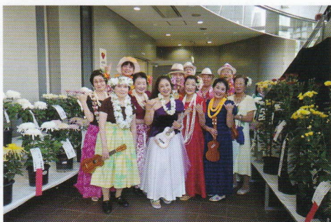
明るく楽しい仲間たち、日頃の練習の成果を披露しました。

最近、独自に文化祭を開催する自治会・町内会も増えています。文化祭は、地域の人たちが気軽に集い、語り合う場になっているのでしょう。