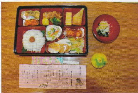
お弁当、目で味わって下さい。