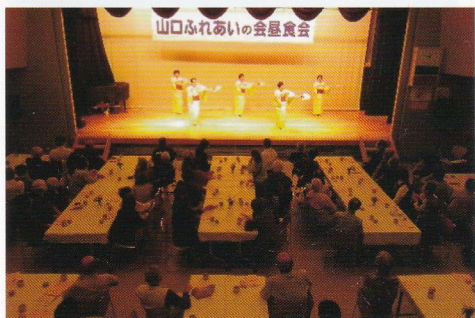
サークルのみなさんありがとう。

「山口ふれあいの会」の皆さんが何日もかけて準備し、心を込めて作ったお弁当です。70 歳以上の方を対象に 25 年間続いています。楽しい会話がはずんで、より一層おいしくなりました。アトラクションはサークル連協の皆さんによるハワイアンと尺八の演奏、日本舞踊と民謡の踊りを楽しみました。