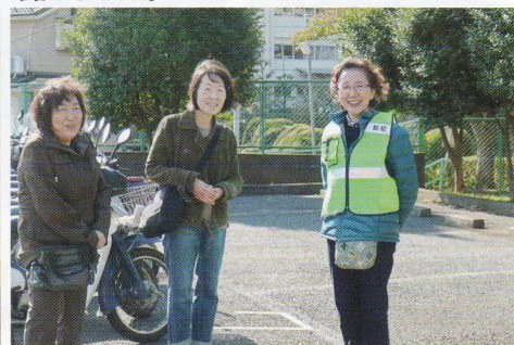
文化祭を裏で支えてくれた大勢の皆さん お疲れ様でした。