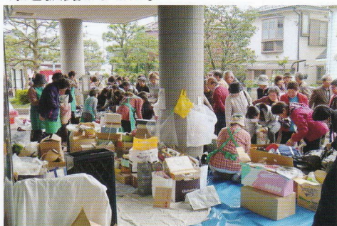
大盛況、福祉バザーの売上は「山口ふれあいの会活動資金」として使われます。