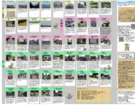
表面：美しい風景、石碑、社寺の写真と説明、山口の昔話などが載っています。