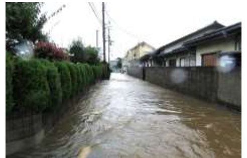
平成28年 道路冠水 (山口地区内)

日頃、地域や近隣の人々と顔を合わせ、お互いに協力し合いながら「いざという時」に備えましょう。