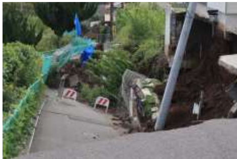
平成29年 道路陥没 (山口地区内)

防災訓練に参加して避難場所や避難経路を確認しておくことが大切です。また、個人で準備保存の防災備品、飲料水や保存食などの点検見直しも忘れずに！