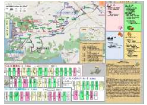
裏面：4つのルートと見どころが載っています。あなたはどのルートを歩きますか。