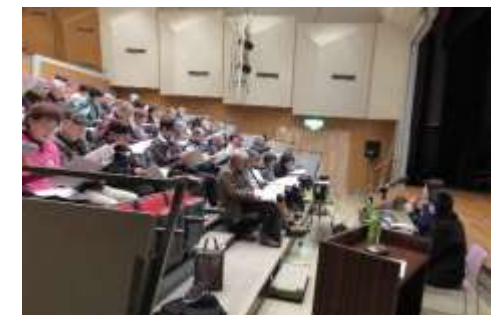
熱心に受講する皆さん。

山口地区では、誰もが安心できる、まちづくりを目指して「迷い人声かけ運動」を行っています。次回(第3回)は、3月14日(土)に氷川町内会館で開催する予定です。