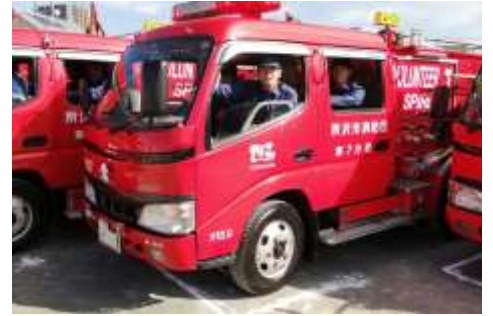
特別点検では市内の消防団の消防車両が勢ぞろいします。

「一緒に地域貢献しませんか？」所沢市消防団第7分団では団員を募集しています。詳しくは第七分団のホームページをご覧ください。最寄りの消防署へお問い合わせ下さい。