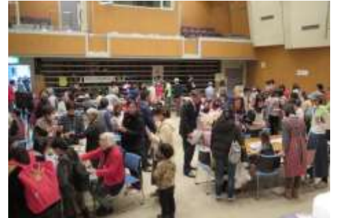
どのコーナーも賑やかでした。

遊びのコーナー、ものづくりコーナーでは、子どもたちがおじいさん、おばあさんたちからいろいろなことを教えてもらい、皆で楽しく過ごしました。高齢者には血圧測定、血管年齢測定もありました。帰りにはポップコーンのおみやげがあり、子どもたちはよろこんでいました。