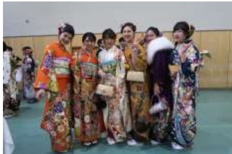
一緒に遊び、学んだ友、いつまでも仲よし仲間であって下さいね。