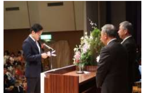
「グローバル」、ふるさと山口を忘れずに!