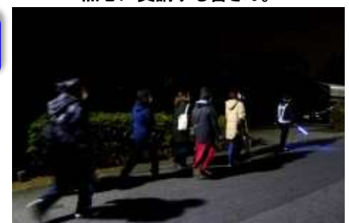
師走の寒さにもめげず歩きました。

上山口中は夕方4時から、山口中は6時からと開始時間は異なりましたが、それぞれ小グループに分かれ、約1時間近く、通学路などの安全を確認しながら歩きました。