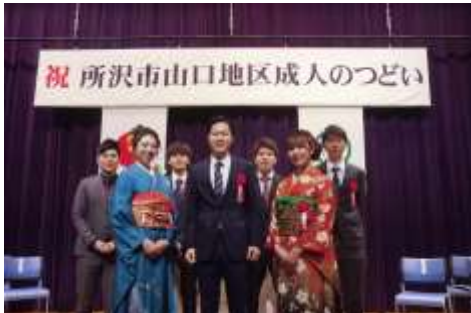
新成人実行委員の皆さんお疲れ様でした。