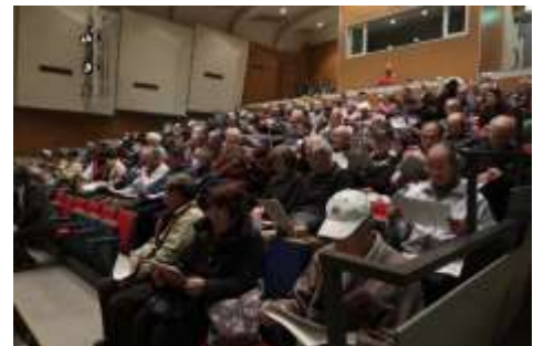
ホールは満席、地元の歴史に対する関心の高さが伺えます。

また、慶長年間に始まり伝承400余年の歴史を持つ岩崎獅子舞(所沢市無形民俗文化財、毎年10月第2土曜日に奉納)が泉小の授業にも取り入れられ、次世代を担う子どもたちにしっかりと伝えられていることも紹介されました。