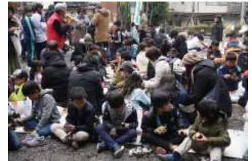
落葉拾いやゲームの後は境内に座り込み、皆で甘〜い焼いもを頬張りました。

この焼いも大会は、法務省が主唱する「社会を明るくする運動」の一環として平成2年から毎年開催され、主催者はもとより、中氷川神社と氏子、小中学校とPTA・愛校会の皆さんをはじめ、世代を超えた多くの地域の人たちの協力により運営されています。子どもたちは皆で協力して一つのことを成し遂げる喜びを学び、地域一体となった子育てに繋がっています。