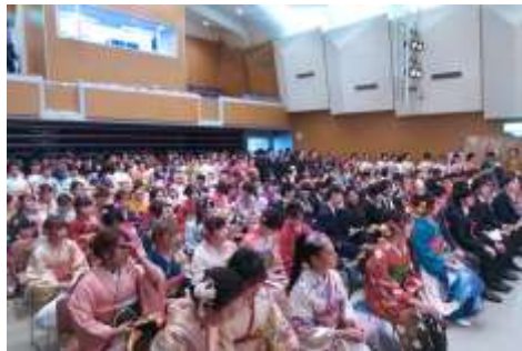
会場は若さいっぱい、熱気に溢れました。