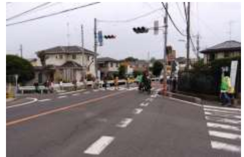
小学生は間隔を取って元気に登校練習(5月26日と28日)。

コロナ禍により3月から休業となっていた学校が6月1日(月)から再開されました。小・中学校の入学式は、来賓なし、保護者1名のみでの参加可とした上で同日に実施されました。再開当初3週間の登校は午前と午後に分けた2部制で行われました。今年度の予定は次のようになっています。 1学期：6月1日(月)～7月31日(金) 夏休み：8月1日(土)～8月17日(月) 2学期：8月18日(火)～12月28日(月) 3学期：1月6日(水)～3月26日(金) (出典：所沢市ホームページ)