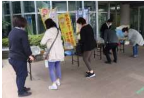
まちづくりセンターで除菌液を無料配布。テイクアウト支援のぼり旗。