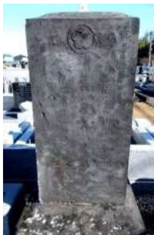
入道一乗の碑(海蔵寺)

長い間ご先祖様をお守りしてきた旧本堂の建造は寛政二年（1790）でした。平成29年10月に本堂を再建し寺門興隆を図った際に、旧本堂天井裏より位牌や法具、貴重な資料が見つかりました。山口城との関わりが記された天保6年（1835）岩岡家建立の碑です。当時の山口城管理地範囲他、兒子が池伝説、今日に伝わる地名など大変興味深いことが記されています。（参考文献・埼玉県入間群誌・碑集・海蔵寺 寺伝・岩岡隆氏資料他）