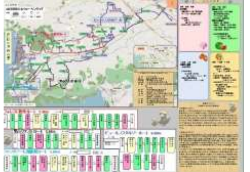
歴史も旧跡も分かる山口オリジナルマップ。

「山口ほほえみウォーキングマップ」は、山口地区まちづくり推進協議会の学習文化部会が製作したものです。表面には山口地区の美しい風景、石碑、社寺の写真と説明、山口の昔話などが、裏面には4つのルートと見どころが載っており、山口まちづくりセンターで入手可能です。