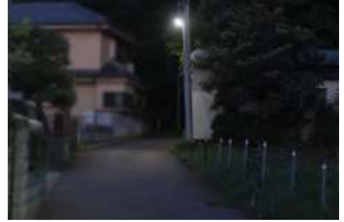
暗かった夜道もこれで安心です。

菩提樹自治会内に防犯灯が新設されました。場所は所沢乗馬クラブの近く、住宅地から山道に入る付近です。埼玉県西部電設協力会様から寄贈されたもので、所沢市建設総務課の紹介を受け山口地区自治連合会が設置場所を推薦しました。設置後は自治会の管理となります。山口地区では毎年概ね1灯の割合で埼玉県西部電設協力会様から寄贈を受けています。