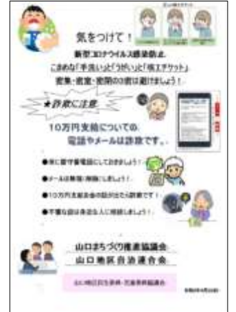
字が細かくて読みづらいので実物は福祉掲示板をご覧ください。