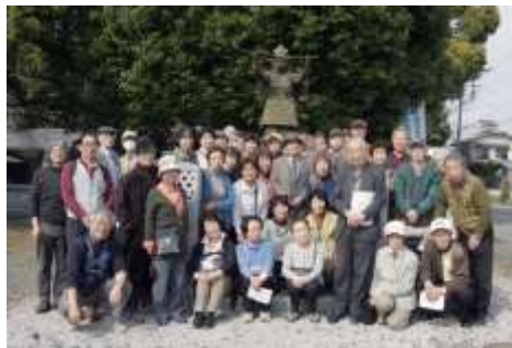
山口歴史勉強会記念・生品神社にて。(平成28年3月8日)

それ以前の建長5年(1253)、宗尊親王(むねたかしのう)の命により創建された寺は鎌倉攻め時に焼失、そして戦禍の治まった跡地に応永元年(1394)上杉氏定(うえすぎうじさだ)が、心昭空外(しんしょうくわがい)を開山として再興されたと伝えられるのが「鎌倉の海蔵寺」です。