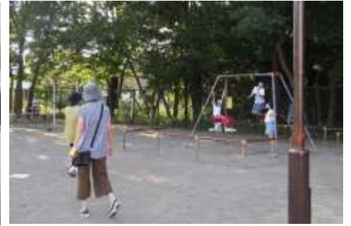
公園で遊ぶ子どもたちに声かけ。