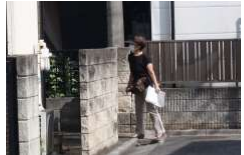
未掲示の家は班長が個別に安否確認を行いました。