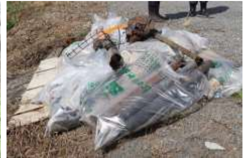
不心得者は誰だ!! 錆びてバラバラになったバイクも捨てられていました。