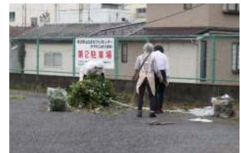
第2駐車場もきれいになりました。

9月10日（木）、山口公民館利用サークル連絡協議会の役員有志とまちづくりセンター職員が参加して、まちづくりセンターの建物周辺と第2駐車場の除草作業を行いました。例年は9月下旬に行うことが多いのですが、今年は少し早めです。コロナ禍の影響により、参加者は例年よりも少なく、作業時間も短めでした。それでも、夏の間に生い茂った雑草がきれいに刈り取られ、さっぱりとしました。