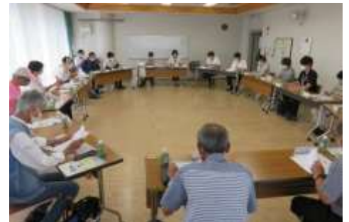
「トコロみまもりネット」では官民が一体となり、皆で高齢者を見守ります。