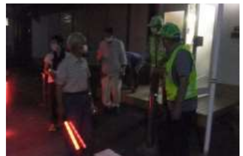
蒸し暑い中、これから出発です。

パトロールをする中で、耕地川の護岸異常と防犯灯の異常が確認されたので、市へ対策を依頼します。