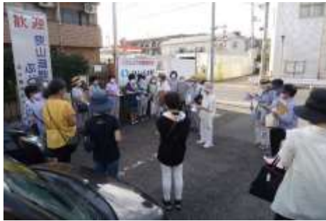
まだ暑い中、なかよし駐車場に集合。

8月24日(月)と28日(金)、更生保護女性会山口支部は恒例の夏の子ども見守りパトロールを行いました。今年にはコロナ禍の影響により夏休みが終わった後のパトロールとなりました。夕方16時にJA前のなかよし駐車場に集合した後、いくつかのグループに分かれてそれぞれのコースをパトロールしました。山口地区では、各校の先生方やPTA、自治会・町内会をはじめ多くの方々子どもたちの安全を見守っています。