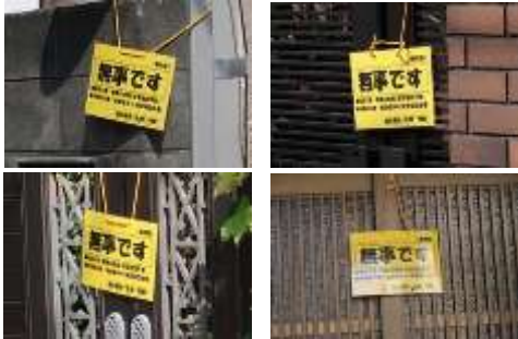
朝9時までに多くの家が玄関や門扉に「安否カード」を掲示しました。

43号の防災記事は参考になりましたでしょうか。今年度は8月29日（土）に予定された総合防災訓練がコロナ禍のために中止となりましたが、本号では、独自に実施した岩崎3号自治会の防災訓練について紹介します。訓練内容は、当自治会で昨年からはじめた「安否カード」を使った安否確認訓練です。避難行動要支援者に対しては自治会と民生委員が連携して安否確認を行います。また、「安否カード」は自治会会員だけでなく、未加入者にも配布されており、地域全体の安全を前提とした防災意識の高さが伺われます。「安否カード」はB5版の大きさで、表面、裏面とも具体的かつ必要最小限の情報しか書かれていないので、実際の災害時でもやるべき行動を容易に確認することができます。