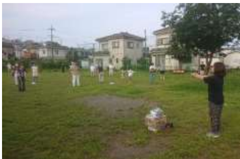
早朝、三密を避けて伸び伸びと健康体操。

参加者は総勢144名（子ども25名）、早朝のせいか子どもが少なかったです。参加した方々には、心ばかりのプレゼントがありました。