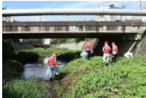
川に降り、足元に気を付けながらビニール袋を片手にごみを拾いました。