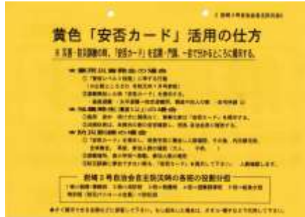
裏側には自治会の取り決めが簡潔に書かれています。