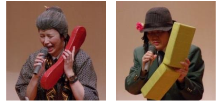
振り込め詐欺の犯人は実に巧妙な 手口で心の隙をついてきます

所沢警察署からは、振り込め詐欺撲滅 をねらいとした「迷惑電話チェッカー」 の紹介とモニター募集の案内がありま した。（モニター募集は 3 月 31 日で終 了しました）