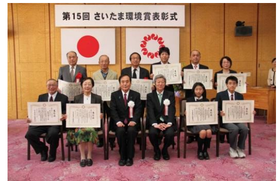
第 15 回 さいたま環境賞表彰式 鈴木会長（後列左から 3 人目）、上山口中生徒会長（前列最右）