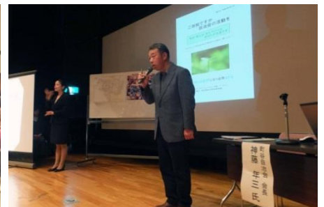
町谷自治会の先進的取り組みを紹介