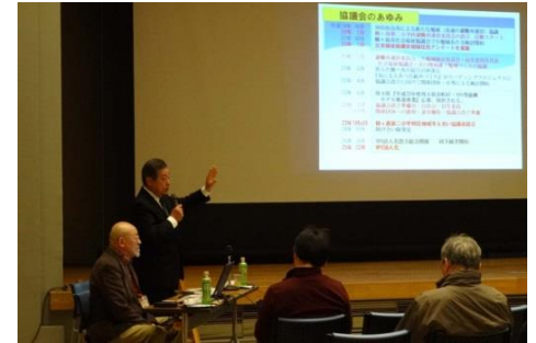
第 2 回「自分達で主体的に楽しく行動すると、地域の輪も広がります」