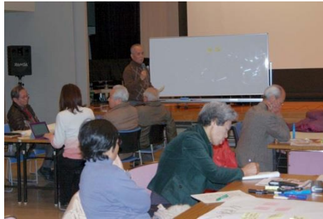
第 1 回「山口の魅力は？」グループに分かれて話し合いました