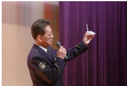
警察などから提供される迷惑電話番号 が自動登録されます