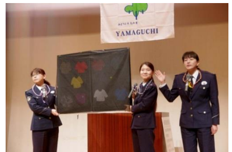
明るい色でも暗いところではこんな に見づらくなります