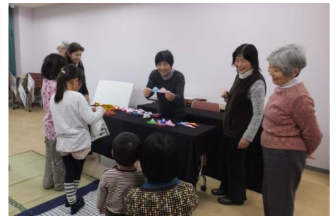
ひな人形の折り紙をプレゼント (3月1日)